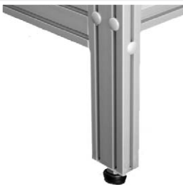
Stelvoetjes ten behoeve van het waterpasstellen