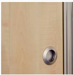
Aluminium look komgrepen