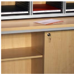
Tussen legbord en schuifdeuren