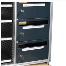
Postdeurtjes met cilinderslot