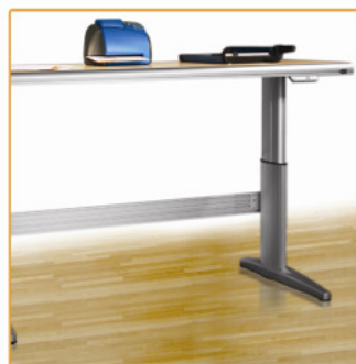
Hoogteverstelling op 1.070 mm