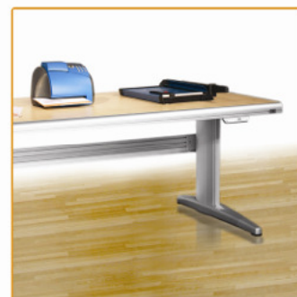
Hoogteverstelling op 620 mm