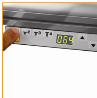
4 instelbare standaardhoogtes