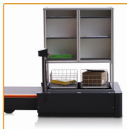
Docking unit met opbouw 'New York'