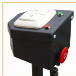
Bediening met hoog/laag indicator